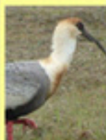
Curcaca Theristicus caudatus