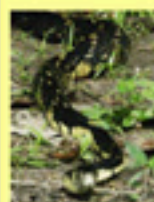
Camponotus Scolites juratae